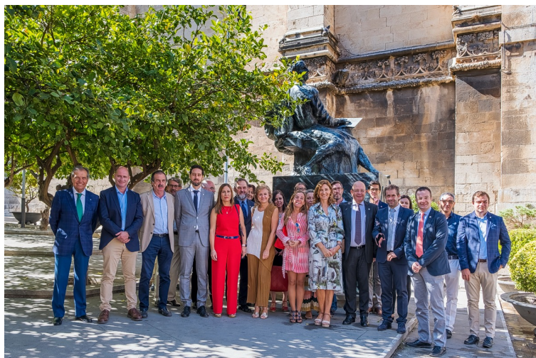
Inicio de la visita a la Catedral de Jaén.