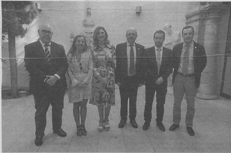
Autoridades participantes ayer en el Día Mundial de la Arquitectura.