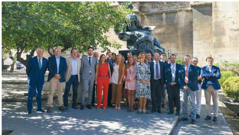
Conmemoración del Día Mundial de la Arquitectura.