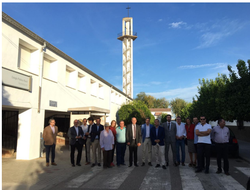
Asistentes al acto en Llanos del Sotillo (Andújar)